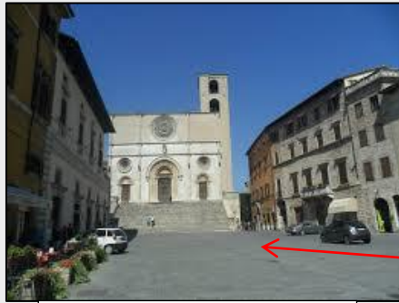
Piazza del Popolo