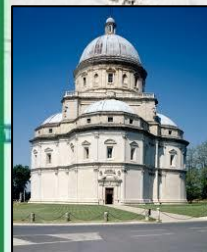
Tempio della Consolazione